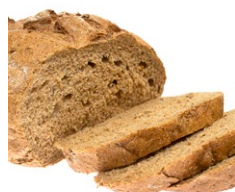
Korn- produkter med gluten- indhold