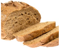
Korn- produkter med gluten- indhold