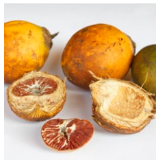
Skalfrugter / nødder