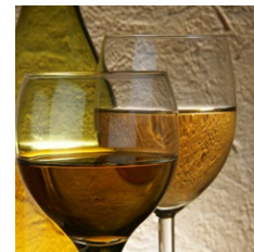
Svovldioxid og sulfitter over 10 mg/ kg eller liter (f.eks. i vin)