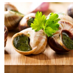
Bløddyr (snegle, muslinger, østers m.m.)